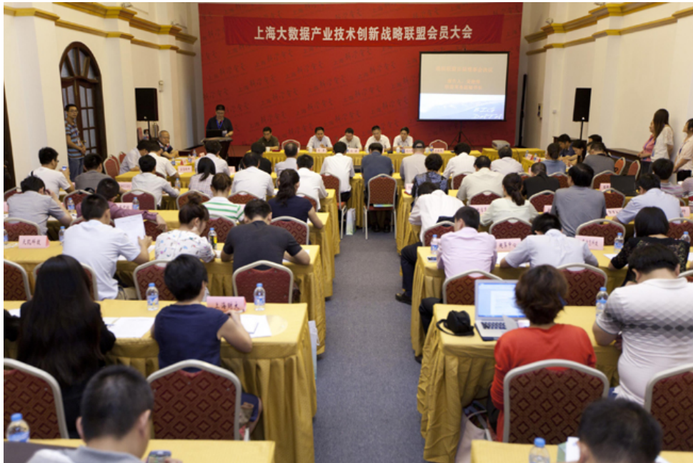
上海大数据产业技术创新战略联盟第一次成员大会现场

会上，市科委发布了《“大数据三年行动计划”推进管理办法（试行稿）》，宣读了联盟首届理事会决议。联盟首批成员单位代表签署了联盟《共同协议书》。